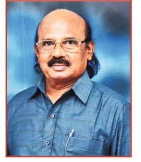
பா. சேவியர் திண்டுக்கல்

2சாமு. 7: 1-5, 8-12, 14-16 உரோ. 16: 25-27, லூக். 1: 26-38